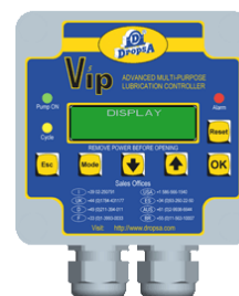
VIP5 COD. 1639140 à 1639155

Il facilite la configuration des paramètres de fonctionnement, et permet le pilotage d'une électrovanne pour les systèmes de pompage à simple effet et la surveillance des dispositifs des capteurs montés sur les diviseurs progressifs.