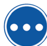
Множество других приложений