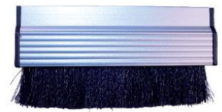
K001012 Poils 1/4BSP/F/P, 20 mm de longueur Largeur totale 32 mm, longueur 100 mm, profondeur 48 mm