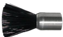
2049009 Poils 1/8BSP/F/P 35 mm de long, 17 mm Ø longueur totale 60 mm