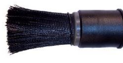
K001011 Poils 1/4BSP/F/P 40 mm de long, 20 mm Ø longueur totale 70 mm