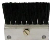
2037165 Poils 1/8BSP/F/P 30 mm de long, 57 mm de largeur longueur totale 50 mm